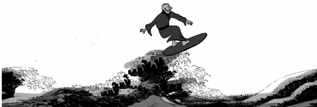
Stressbewältigung durch Achtsamkeit.